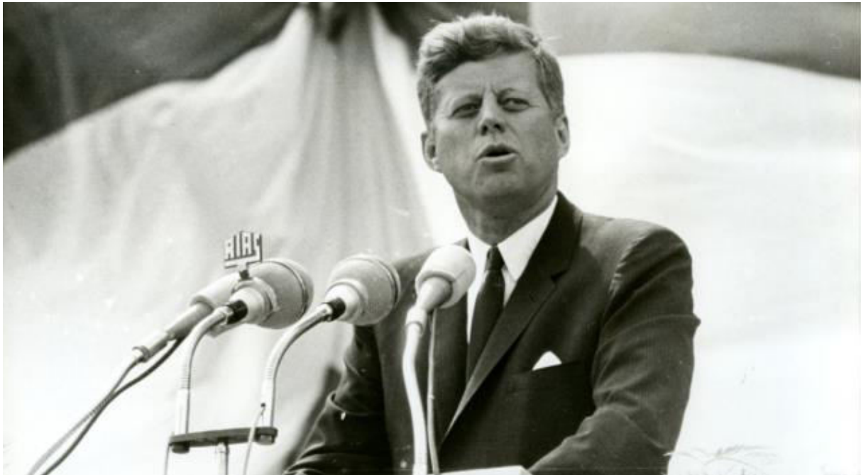
John F. Kennedy in Berlin

Heute vor 55 Jahren wurde John F. Kennedy ermordet. Aus diesem Anlass veröffentlichen wir eine seiner bekanntesten Reden, in der er gegenüber der Presse zum ersten Mal die Gefahren des Deep State ( „ Der Tiefe Staat “ ) beschreibt und um deren Zusammenarbeit bittet, damit über die Medien die Bevölkerung aufgeklärt werden kann.